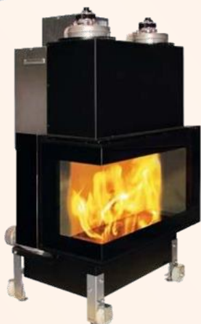
Facel 800 VAG