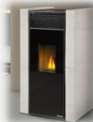
Poêles à granulés